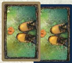
1 Чифт обувки