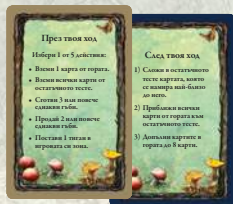
6 Референтни карти